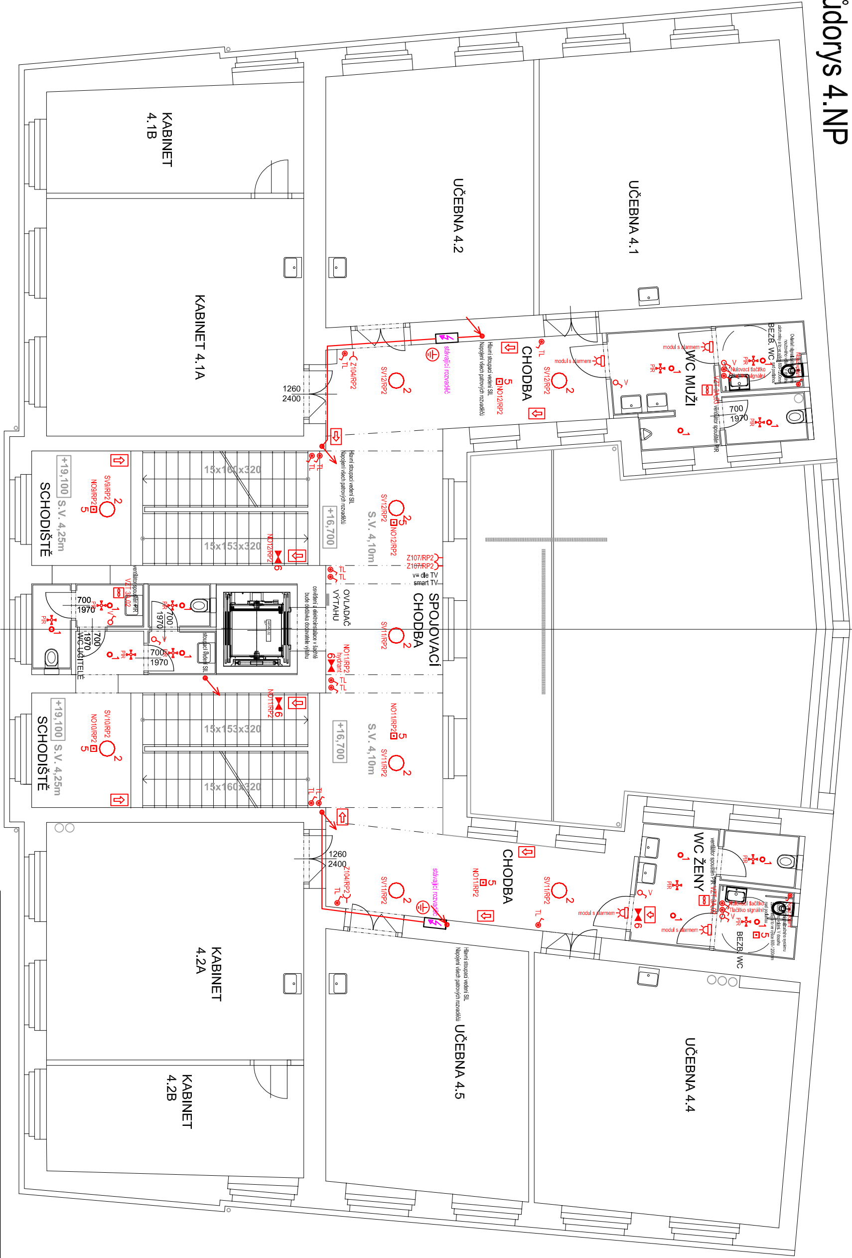
TABULKA POUŽITÝCH ZNAČEK - SILNOPROUD